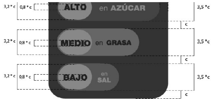
PORCENTAJES REALES DE LAS BARRAS TAMAÑO RELATIVO